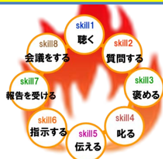
実践型リーダーシップ研修 8つのコミュニケーションスキル

毎年ご参加のある企業様では、リーダー職の必須研修とされています。開講以来毎年人気で5年目となりました。周りからの評価で「受講後、部下育成の意識が変わった」など、うれしい声がたくさん届いています。