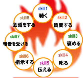
実践型リーダーシップ研修 8つのコミュニケーションスキル

毎年ご参加のある企業様では、リーダー職の必須研修とされています。開講以来毎年人気で5年目となりました。周りからの評価で「受講後、部下育成の意識が変わった」など、うれしい声がたくさん届いています。