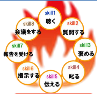
実践型リーダーシップ研修 8つのコミュニケーションスキル

開講以来毎年人気で9年目となりました。周りからの評価で「受講後、部下育成の意識が変わった」など、うれしい声がたくさん届いています。リーダー職の必須研修としてご評価いただいている企業様もおられます。